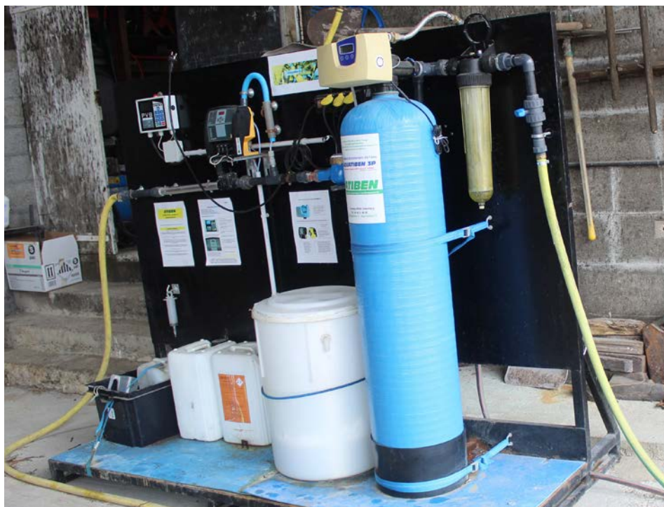
La station de traitement de l'eau Aquatiben 3P.